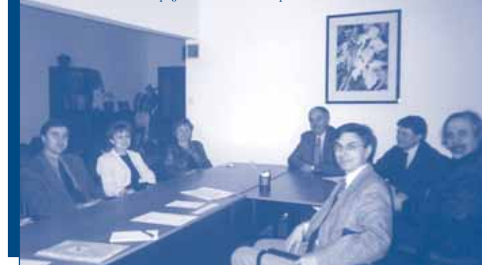
Учредяване на ИИС – София