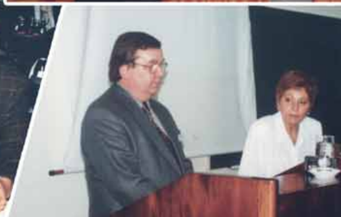
Обмен на идеи