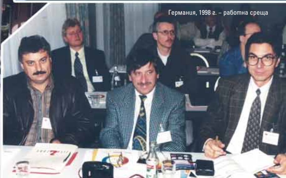
Германия, 1998 г. – работна среща