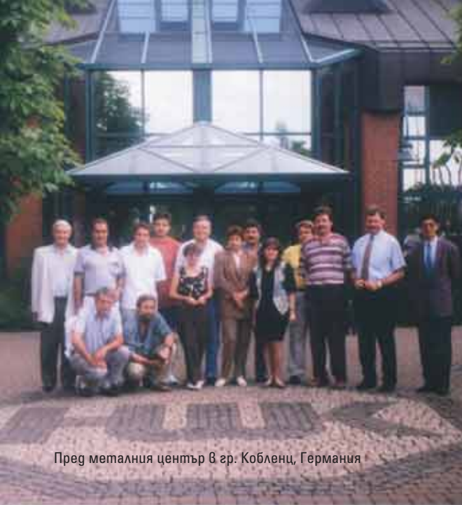
Пред металния център в гр. Кобленц, Германия