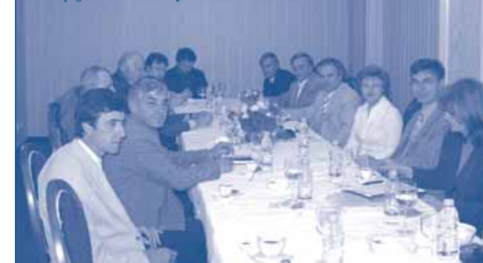
Учредяване на ИИС – Русе