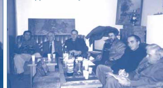
Учредяване на ИИС – Пловдив