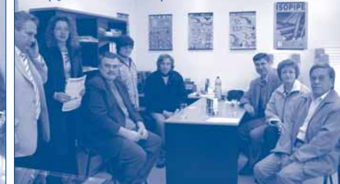
Учредяване на ИИС – Велико Търново