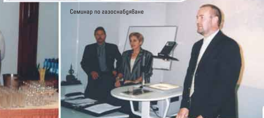
Семинар по газоснабдяване