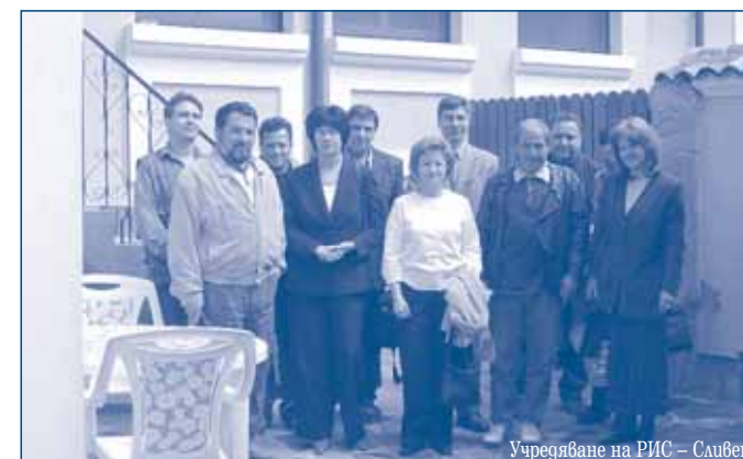
Учредяване на ИИС – Сливен