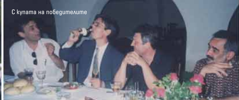
С купата на победителите