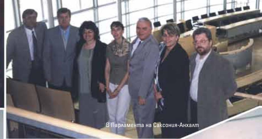
В Парламента на Саксония-Анхалт