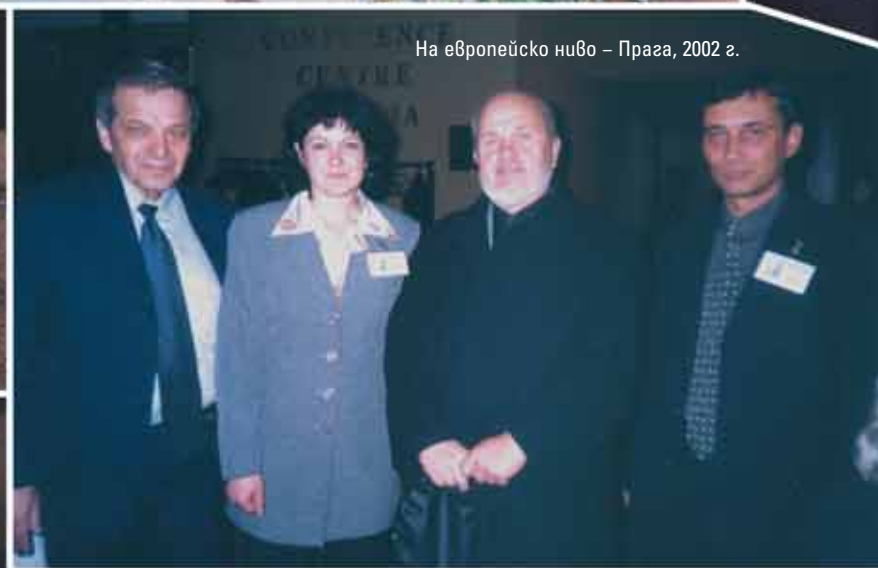
На европейско ниво – Прага, 2002 г.