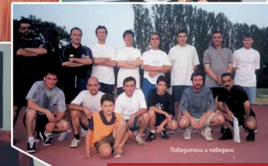
Победители и победени