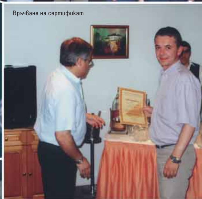
Връчване на сертификат